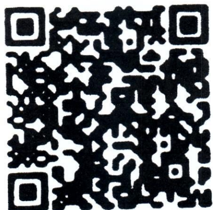
QR Code ทะเบียนเป้าหมาย/แบบรายงานการจัดทำสื่อวีดิทัศน์