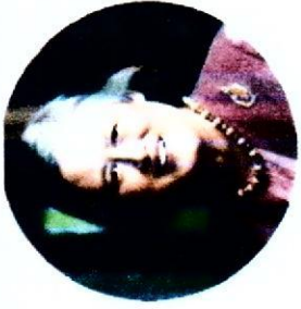
หมวดที่ ๓