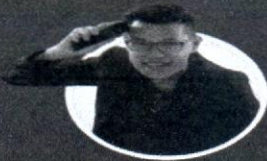
โค้ชฟเอก ยอดสร

ทีมวิทยากรรับเชิญพิเศษโค้ชซึ่งด้านการทำตลาดออนไลน์