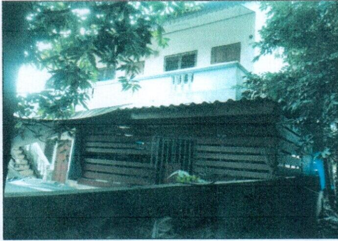
บ้านนายกระจ่าง เป็นหอพัก ๒ ชั้น จำนวน ๖ ห้อง