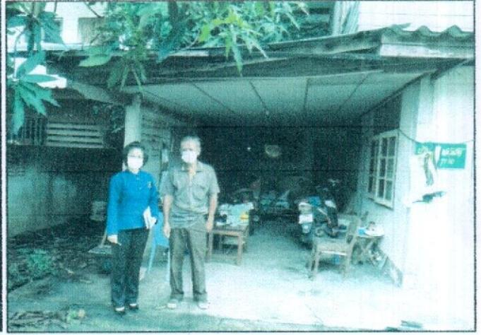
ปัจจุบันนายกระจ่าง อาศัยบ้านพี่ชายรั้วติดกัน