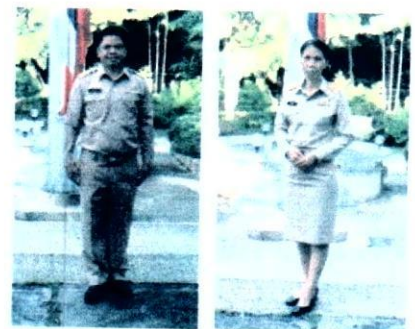
ชุดเครื่องแบบข้าราชการ

ตัวอย่างการแต่งกายของผู้เข้ารับการฝึกอบรม