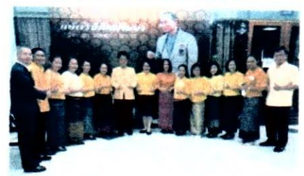
ชุดผ้าไทย